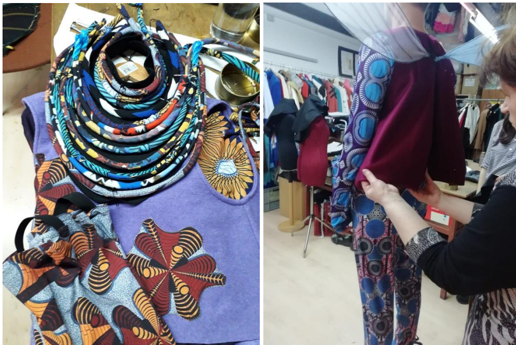
SLIKE 2 i 3. proces realizacije kostima u krojačnici za dječju predstavu Z.Pongrašić „Malac komalac“. Redatelj: Lawrence Kiiru . Scenografija: Stefano Katunar. Kostimografija: Barbara Bourek. Gardsko kazalište Žar Ptica, Zagreb. ožujak 2020.