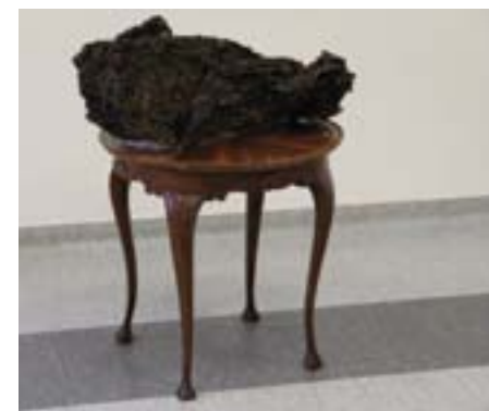
Crvi , instalacija

Vrijeme je postojano kao i crvotočina. Crvljivost je životna kao i drvo. Prerada podataka ne čini knjigu.