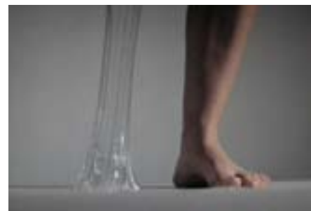
Gravitacija , video